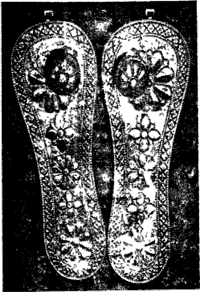
மொலி நாடிவாடி செங்கமலம் மனவாளமர முனிகளின் போர்நாடகம் (தூய்மை)